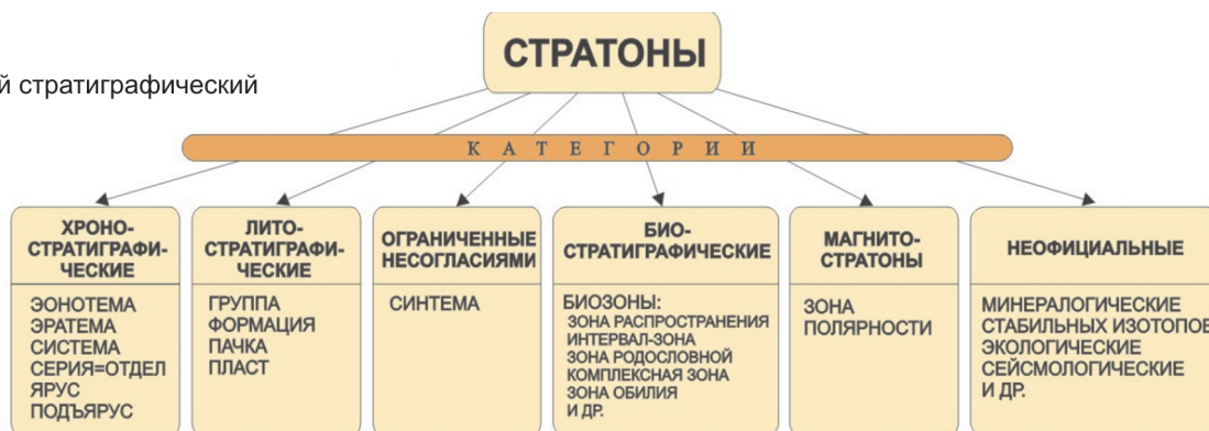
б Стратиграфический кодекс России [8]