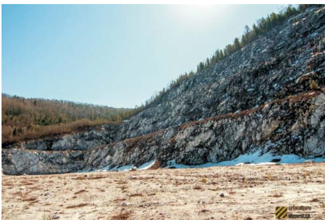
Рис. 9. Карьер Динамитный (с сайта https://urban3p.ru/object18831 )