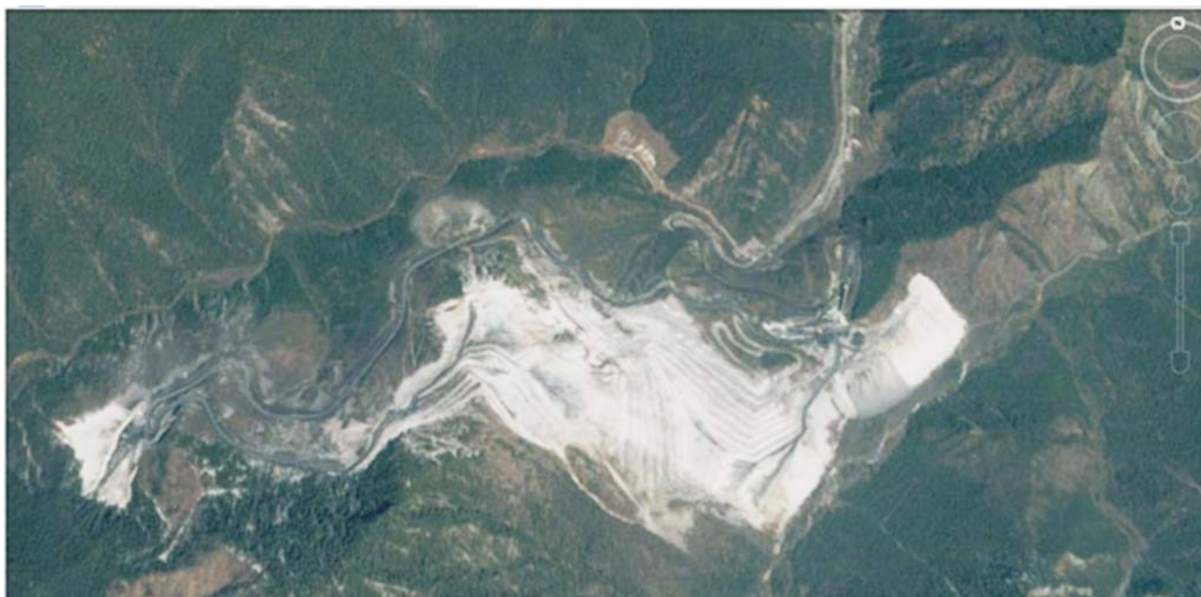
Рис. 2. Карьер на Слюдянском месторождении мраморов (вид из космоса)

Примечание. Токсичность сырья, значимость ландшафта, устойчивость ландшафта: высокая (+++), средняя (++) , низкая (+). Воздействие на компоненты окружающей среды: сильное (+++), умеренное (++) , слабое (+), отсутствует (–).