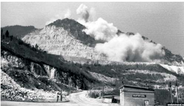
Рис. 4. Взрывные работы на карьере «Перевал» [4]