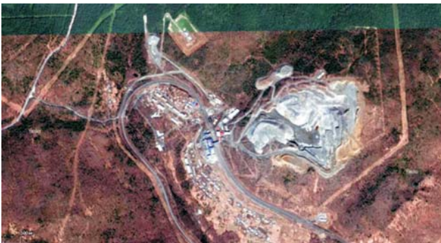
Рис. 5. Карьер Ангасольского месторождения (вид из космоса)

ными слоями сверху вниз с высотой уступа 10 м. Отработка слоя ведется поперечными заходками через каждые 30 м, по высоте оставляются предохранительные бермы шириной 10–12 м. Отбойка породы осуществляется с использованием буровзрывных работ (рис. 4), погрузка в автосамосвалы ведется экскаваторами. Сырье транспортируется на фабрику первичного дробления, после которой по двум подвесным канатным дорогам доставляется на шнековую дробилку, сортируется по фракциям и отправляется на склад готовой продукции, откуда железнодорожным транспортом доставляется на Ангарский цементный завод и прочим потребителям. В 2014 г. добыча мрамора составила 978 тыс. т.