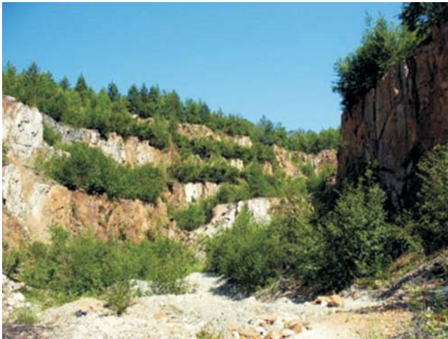
Рис. 8. Карьер рудника № 2 [4]