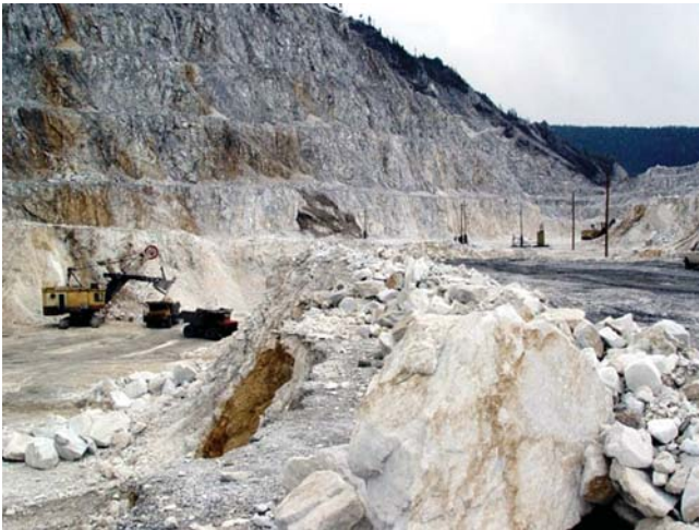
Рис. 3. Слюдянский мраморный карьер [4]