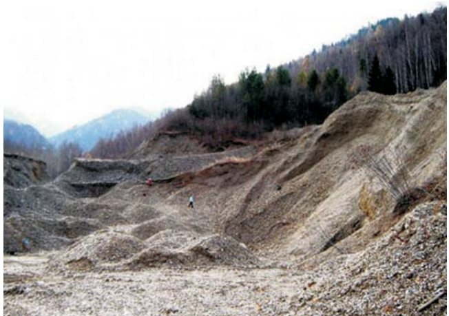
Рис. 7. Современное состояние отвалов шахты № 4 первого рудника [4]

ценность – горнотехническое сырье. Слюда отличается очень высоким качеством. Площадь земель, нарушенных в процессе эксплуатации, 0,27 км 2 . Токсичность сырья – низкая. В настоящее время месторождение законсервировано, карьеры зарастают лесом (рис. 8), кое-где сохранились входы в подземные выработки. Негативные последствия заброшенных подземных горных выработок проявляются в нарушении стока подземных вод и образовании провалов над ними [6].