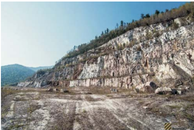
Рис. 10. Карьер Буровщина

ного пункта напротив дачного поселка у подножия склона хребта Хамар-Дабан на высоте 560–600 м над уровнем моря (рис. 10). Здесь на крутых склонах развиты кедрово-лиственничные мелкотравно-кустарничковые моховые леса. Начало разработки месторождения относится к периоду строительства Кругобайкальской железной дороги – началу XX века. Из этого мрамора построен железнодорожный вокзал в г. Слюдянке. Нынешний карьер был заложен в 1970 г. Относится к нагорному типу. Полезное ископаемое – мрамор, потребительская цен-